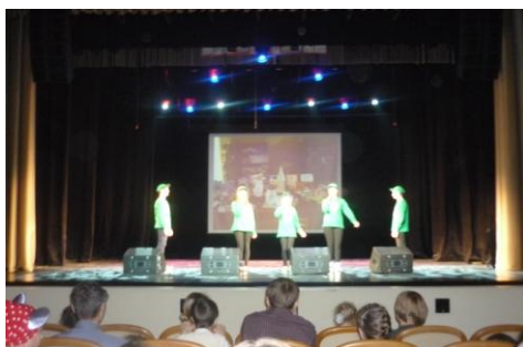
Выступление нашей команды

20 ноября 2016 года в Центре общественной информации КАЭС в г.Удомля прошел отборочный тур областного экологического фестиваля «Я и природа – единое целое». Школьное лесничество «Сосенка» принимало участие в этом фестивале. Наша команда представила на фестиваль исследовательские работы, фотовыставку, разработку экологических уроков. Нам хотелось познакомить жюри и участников фестиваля с системой нашей работы, и это удалось в полной мере. Всего принимали участие в состязании 24 участника. Это сольные и коллективные выступления,