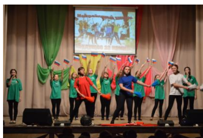
Наши на сцене!

Проблеме здоровья сейчас уделяют большое внимание. Об этом не говорит только ленивый. Естественно, что возросло внимание и к здоровью учащихся. Многие школьники предпочитают проводить свободное время у телевизоров и компьютеров. Тревогу вызывает рост числа юных курильщиков, наркоманов; токсикомания, приобретающая всё более массовый характер.