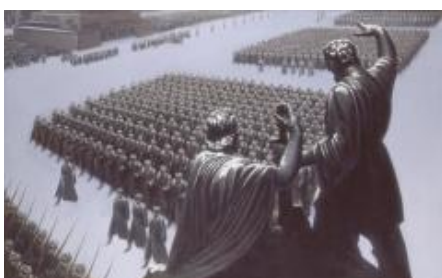
Парад 1941 года в Москве

Проведение военного парада на Красной площади в Москве в 1941 году, в день 24-й годовщины Октябрьской революции и в самые трудные для страны дни Великой Отечественной войны, имело большое военно-политическое значение, оказало моральное воздействие большой силы на боевой дух войск, способствовало эмоциональному подъему и укреплению веры в окончательную победу страны, несмотря на то, что столица была на осадном положении.