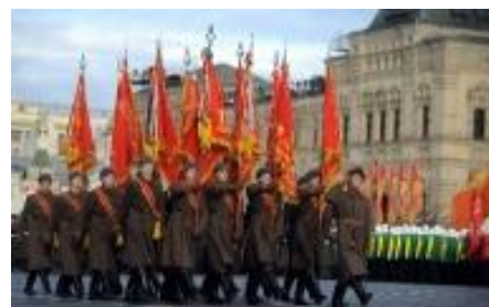
Торжественный марш сегодня

Отечественной войны, курсантов военных училищ, школьников, студентов и различных творческих и патриотических коллективов. По традиции, одной из кульминационных точек является небольшая театрализованная инсценировка, а в заключении — праздничный концерт для ветеранов.